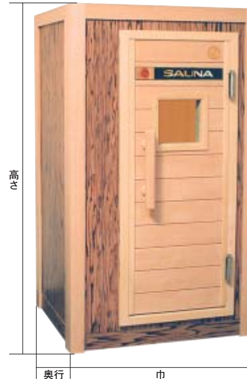
巾850 奥行800 高さ1,500 (mm)